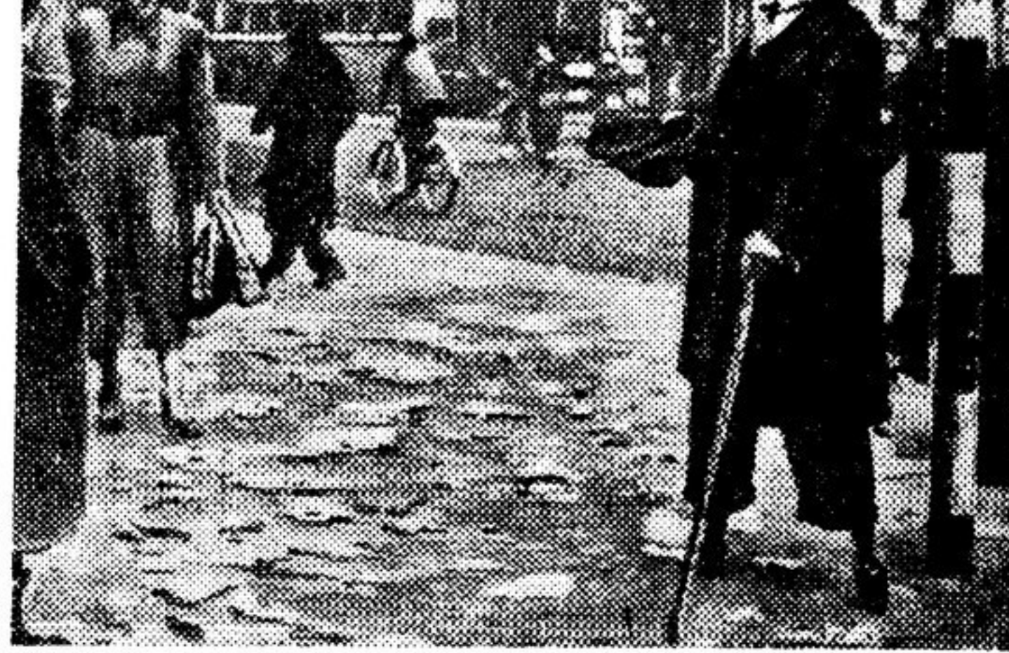
Улица Пинкнилли, Центр Лондона. Инвалид войны леним песком тешно пытается заработать на пропитание...

Недавно я прочитал о больших успехах мелинши, благодаря которым можно произвести пересадку роговой оболочки глаза слепому человеку. Глаза у меня хорошие. И я готов пожертвовать своими глазами ради лучшего будущего для моей семьи. Быть может, найдется слепой человек, который возьмет мои глаза и даст моим детям возможность обрести лучшую жизнь».